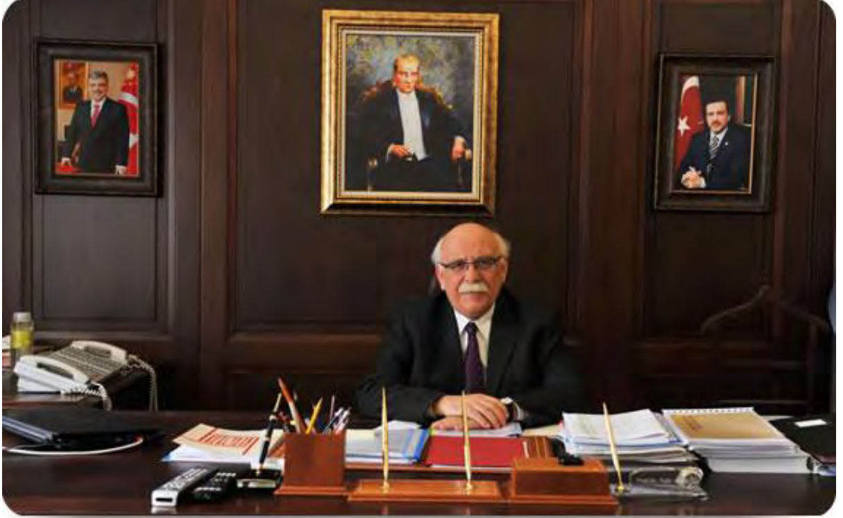
Nabi AVCI Millî Eğitim Bakanı