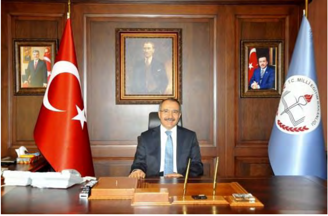
Ömer DİNÇER Millî Eğitim Bakanı