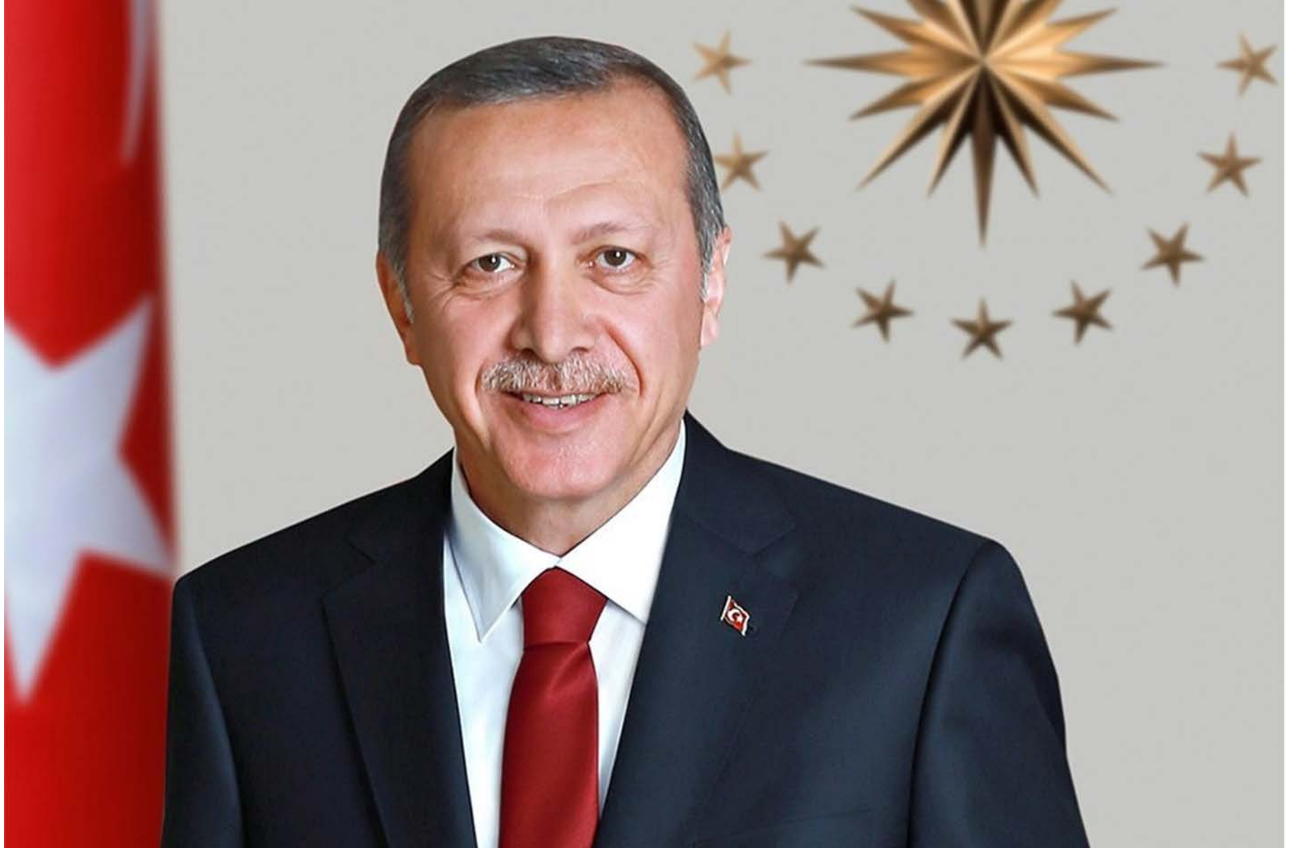
RECEP TAYYİP ERDOĞAN TÜRKİYE CUMHURİYETİ CUMHURBAŞKANI