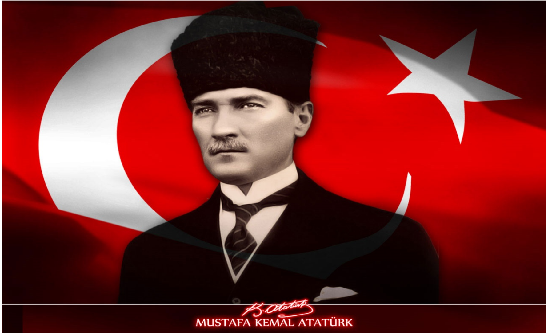
M. Kemal Atatürk MUSTAFA KEMAL ATATÜRK