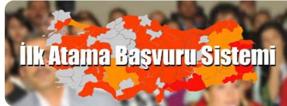
İlk Atama Başvuru Sistemi