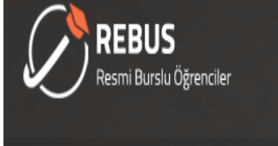
Yurtdışı Resmi Burslu Öğrenciler Sistemi