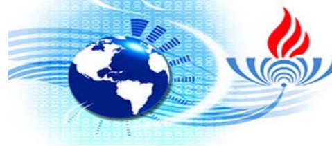
Açık Öğretim Ortaokulu