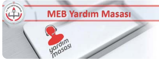
MEB Yardım Masası