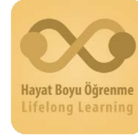
Açık Öğretim Lisesi Mobil Uygulaması