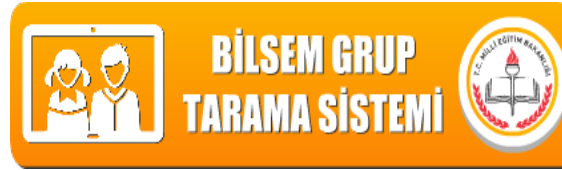
Bilem Grup Tarama Sistemi (mobil)