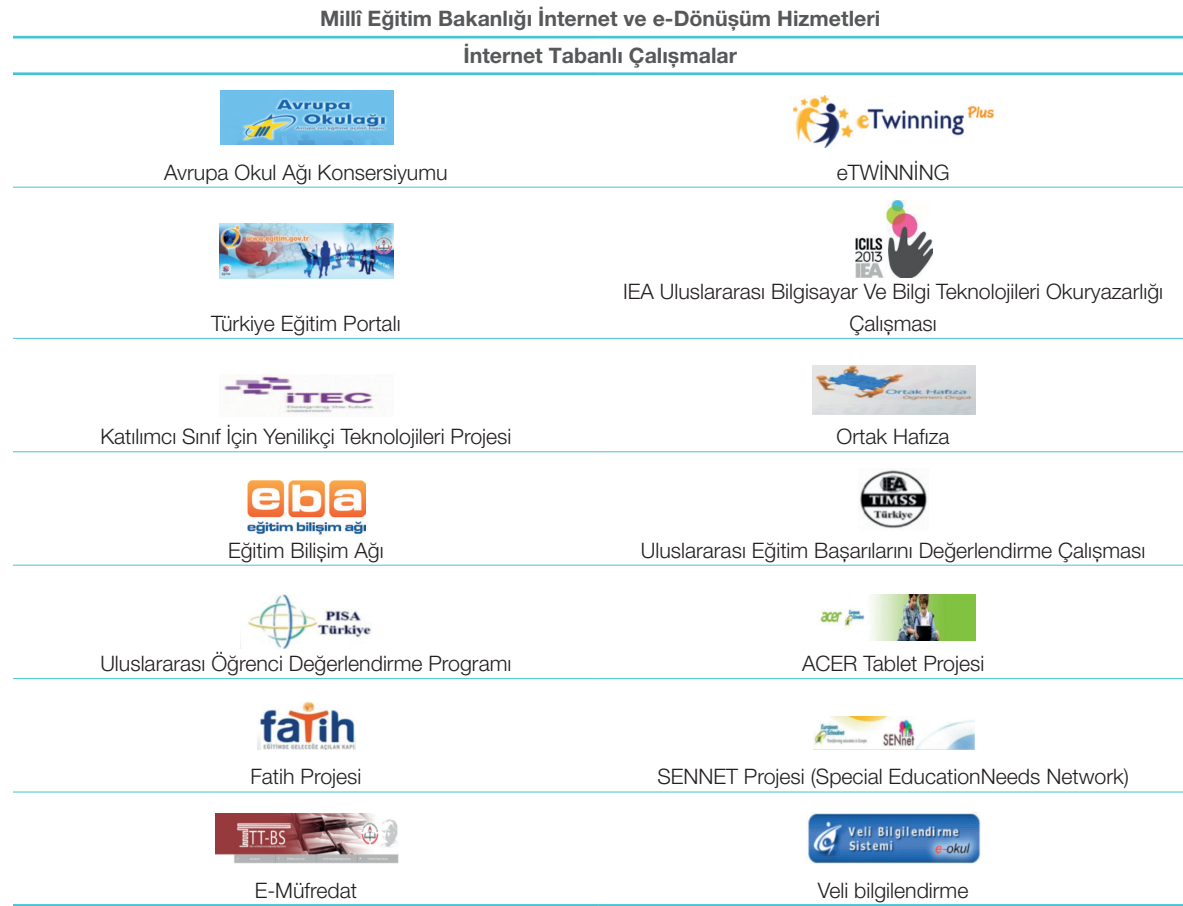
Tablo 1: WEB Tabanlı Çalışmalar

Bakanlığımız internet ve e-Dönüşüm Hizmetleri kapsamında yapılan çalışmalardan bazılarının görselleri aşağıda gösterilmiştir.